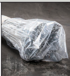
Petit paquet avec sac en PVC

Petits paquets liés avec du ruban crêpe ou des colliers de serrage, les extrémités des petits paquets sont protégés par des sacs en PVC, emballés dans un grand carton sur une palette EUR et fixées avec des cerclages métalliques ou les grands paquets sont pressés avec des cerclages métalliques.