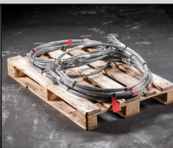
Enroulé sur europalette