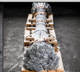
Petits paquets en un grand paquet sur europalette