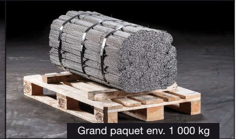
Grand paquet env. 1 000 kg