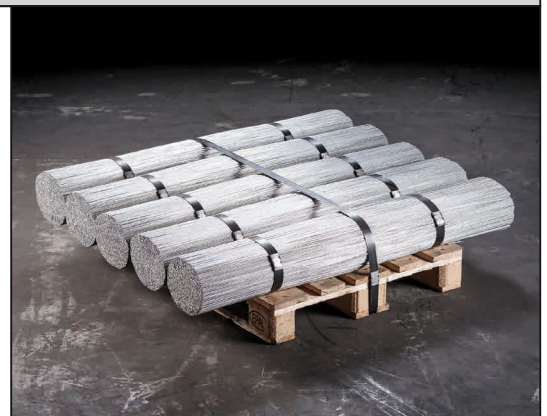
Grands paquets pressés avec des cerclages métalliques.

Petits paquets liés avec du fil de fer, grands paquets pressés avec des cerclages métalliques.